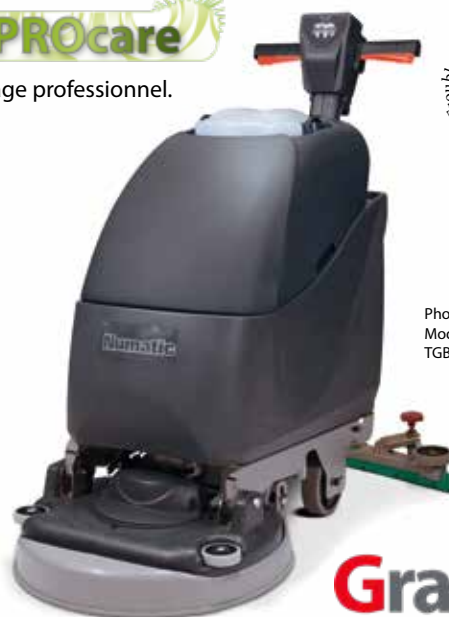
Photo d'illustration Modèle présenté TGB4055