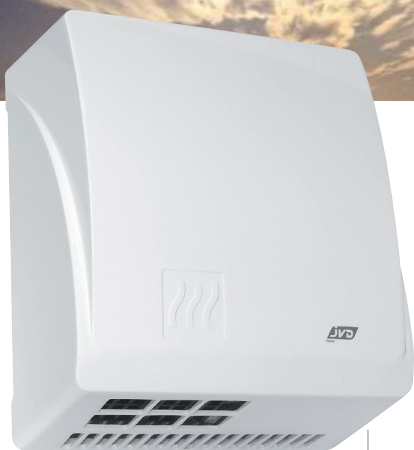
8 11 413