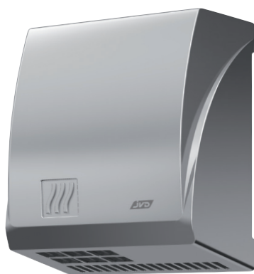
8 11 414