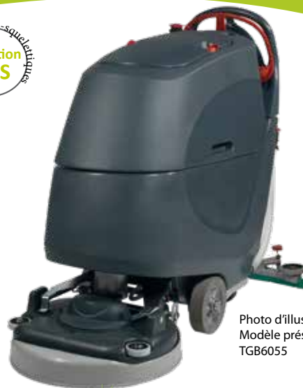
Photo d'illustration Modèle présenté TGB6055