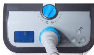
Ecran de contrôle