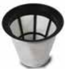
Filtre tissu KTR103023 (3833)