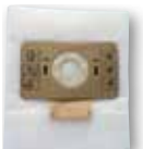
Pochette 10 sacs microfibre classe M KTR104794 (SA 10)