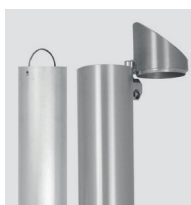
2 SYSTEMES DIFFÉRENTS POUR VIDER