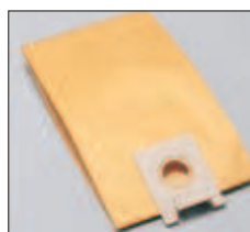
Sac filtre en papier écologique. Ecologische papieren filterzak.