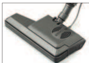
Brosse électrique. Powerborstel.