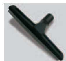
Embout raclette D300. Trekker D300.