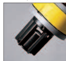
Cage support sac avec flotteur. Mand zaksteun met vlotter.