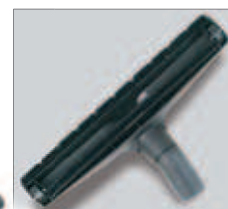
Embout sol D320. Vloerzuigmond D320.