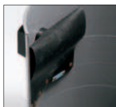
Dispositif anti-mousse. Antischuimsysteem.