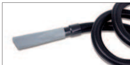
Accessoire spécifique en caoutchouc + tuyau 4 m Ø 40 (seulement pour AUTO). Speciale rubberen accessoire + 4 m lange slang Ø 40 (uitsluitend voor AUTO).