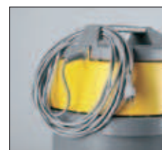
Crochet fixation câble d'alimentation. Haak voor voedingskabel.